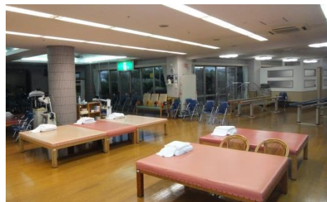
広く設備の整ったリハビリ