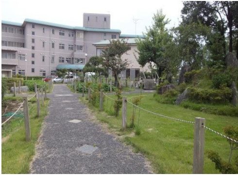
四季を感じる遊歩道