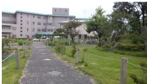
四季を感じる遊歩道