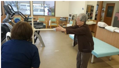
定期的な身体機能評価